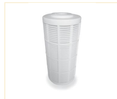
Foto indicativa. La scelta dell'attacco e delle misure comporteranno l'assemblaggio di un prodotto che potrebbe differire da quanto mostrato in figura