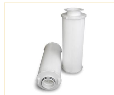
Foto indicativa. La scelta dell'attacco e delle misure comporteranno l'assemblaggio di un prodotto che potrebbe differire da quanto mostrato in figura