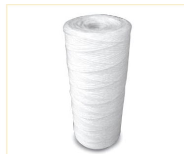
Foto indicativa. La scelta dell'attacco e delle misure comporteranno l'assemblaggio di un prodotto che potrebbe differire da quanto mostrato in figura