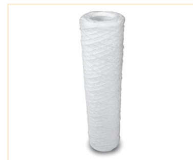
Foto indicativa. La scelta dell'attacco e delle misure comporteranno l'assemblaggio di un prodotto che potrebbe differire da quanto mostrato in figura