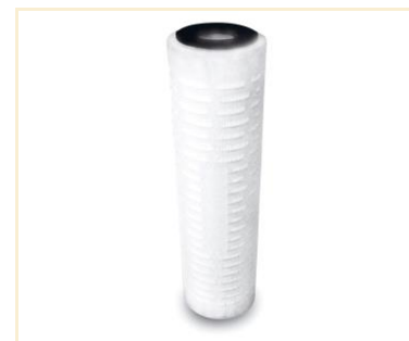
Foto indicativa. La scelta dell'attacco e delle misure comporteranno l'assemblaggio di un prodotto che potrebbe differire da quanto mostrato in figura