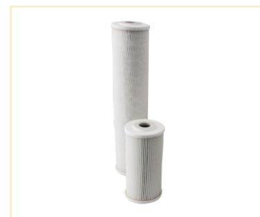
Foto indicativa. La scelta dell'attacco e delle misure comporteranno l'assemblaggio di un prodotto che potrebbe differire da quanto mostrato in figura