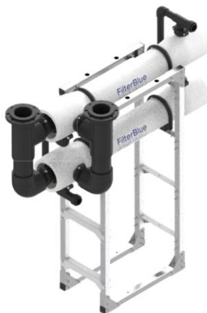
Foto indicativa. La scelta dell'attacco e delle misure comporteranno l'assemblaggio di un prodotto che potrebbe differire da quanto mostrato in figura

Collegamento a foto dettagli prodotto, foto installazioni