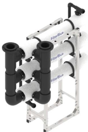
Foto indicativa. La scelta dell'attacco e delle misure comporteranno l'assemblaggio di un prodotto che potrebbe differire da quanto mostrato in figura

Collegamento a foto dettagli prodotto, foto installazioni