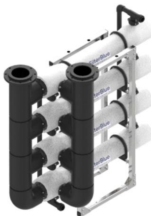
Foto indicativa. La scelta dell'attacco e delle misure comporteranno l'assemblaggio di un prodotto che potrebbe differire da quanto mostrato in figura

Collegamento a foto dettagli prodotto, foto installazioni