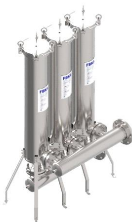
Foto indicativa. La scelta dell'attacco e delle misure comporteranno l'assemblaggio di un prodotto che potrebbe differire da quanto mostrato in figura