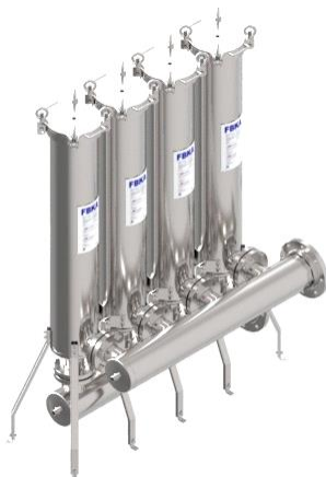
Foto indicativa. La scelta dell'attacco e delle misure comporteranno l'assemblaggio di un prodotto che potrebbe differire da quanto mostrato in figura