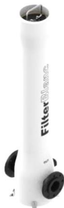
Foto indicativa. La scelta dell'attacco e delle misure comporteranno l'assemblaggio di un prodotto che potrebbe differire da quanto mostrato in figura