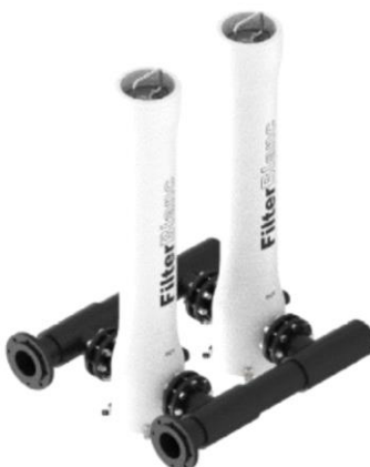
Foto indicativa. La scelta dell'attacco e delle misure comporteranno l'assemblaggio di un prodotto che potrebbe differire da quanto mostrato in figura