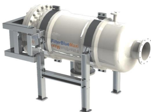
Foto indicativa. La scelta dell'attacco e delle misure comporteranno l'assemblaggio di un prodotto che potrebbe differire da quanto mostrato in figura