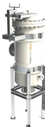
Foto indicativa. La scelta dell'attacco e delle misure comporteranno l'assemblaggio di un prodotto che potrebbe differire da quanto mostrato in figura