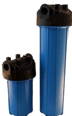
Foto indicativa. La scelta dell'attacco e delle misure comporteranno l'assemblaggio di un prodotto che potrebbe differire da quanto mostrato in figura