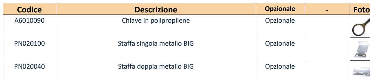
TABELLA CODICI CONTENITORI