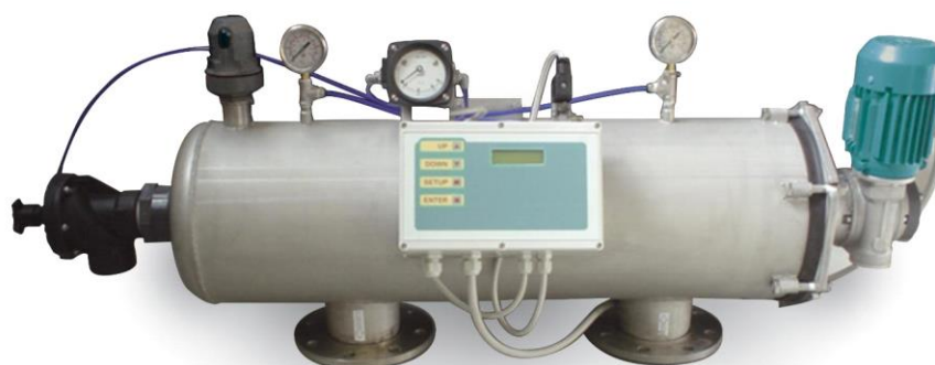
Foto indicativa. La scelta dell'attacco e delle misure comporteranno l'assemblaggio di un prodotto che potrebbe differire da quanto mostrato in figura Per visualizzare il grafico delle portate, stampare la scheda di configurazione dal sito www.everblue.it dopo avere scelto attacco e grado di filtrazione