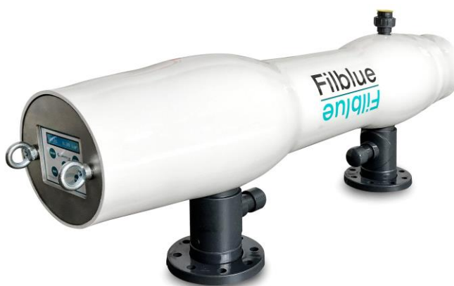
Foto indicativa. La scelta dell'attacco e delle misure comporteranno l'assemblaggio di un prodotto che potrebbe differire da quanto mostrato in figura Per visualizzare il grafico delle portate, stampare la scheda di configurazione dal sito www.everblue.it dopo avere scelto attacco e grado di filtrazione