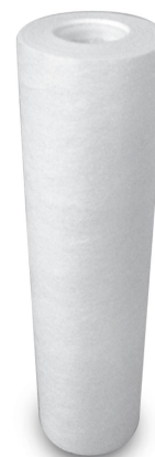
Foto indicativa. La scelta dell'attacco e delle misure comporteranno l'assemblaggio di un prodotto che potrebbe differire da quanto mostrato in figura