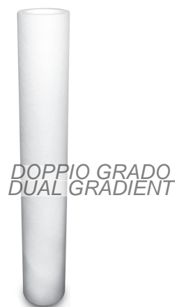
Foto indicativa. La scelta dell'attacco e delle misure comporteranno l'assemblaggio di un prodotto che potrebbe differire da quanto mostrato in figura